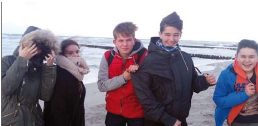
Nad morzem w kurorcie Darss

petencje językowe nieustannie komunikując się w języku angielskim lub języku niemieckim. Zawiązały się wspaniałe międzynarodowe przyjaźnie (a nawet miłości) i ciężko było się rozstać.