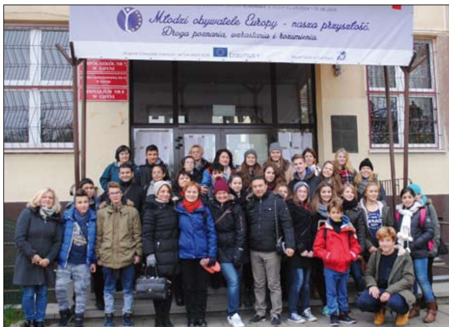
I spotkanie w Polsce - goście projektu przed naszą szkołą