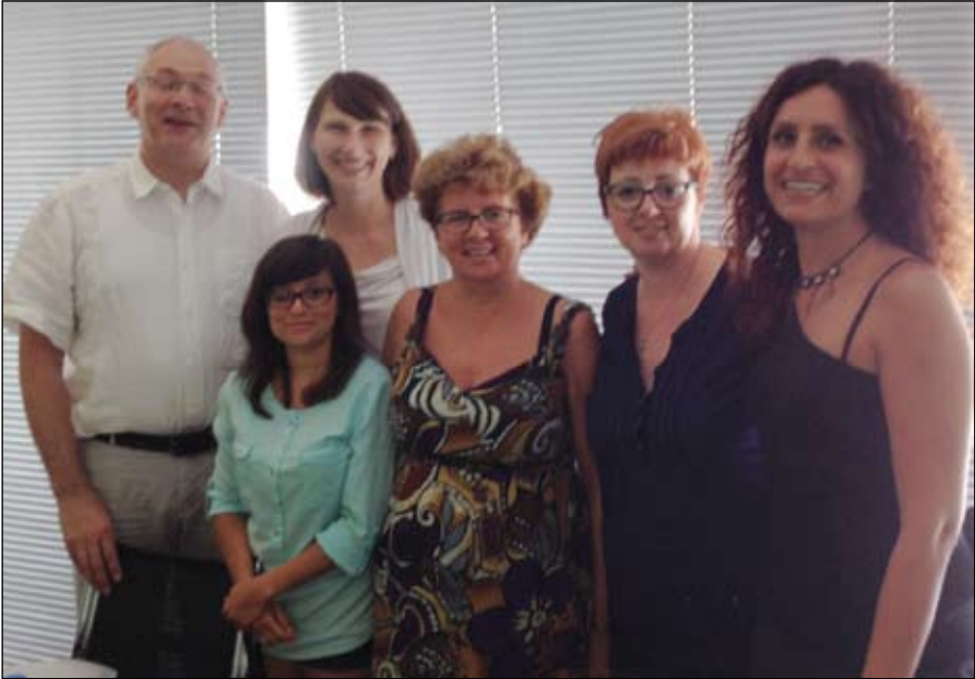
Fot. z archiwum projektu